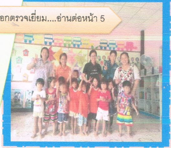
ด้วยกระทรวง การพัฒนาสังคมฯ ดำเนินโครงการ .....อ่านต่อหน้า 6