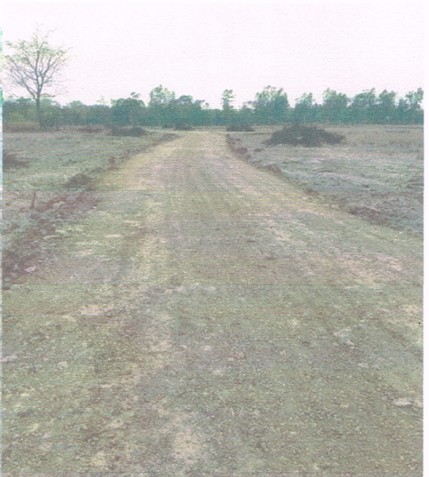
ปรับปรุงถนนลูกรังในพื้นที่ตำบลจานลาน