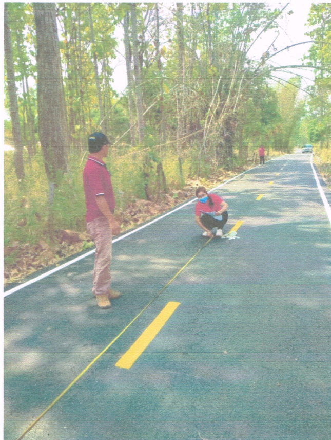
ก่อสร้างถนนแอสฟัลติกคอนกรีตในพื้นที่ตำบลจานลาน