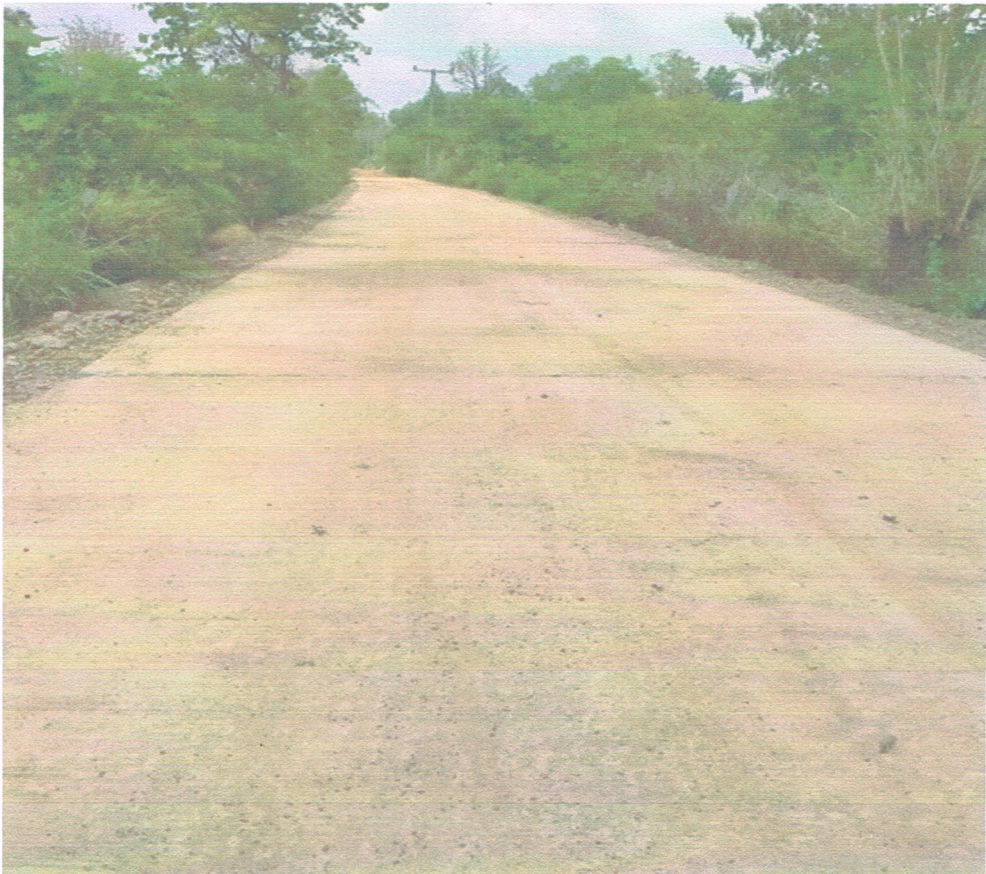
ก่อสร้างถนนคอนกรีตเสริมเหล็กในพื้นที่ตำบลจานลาน