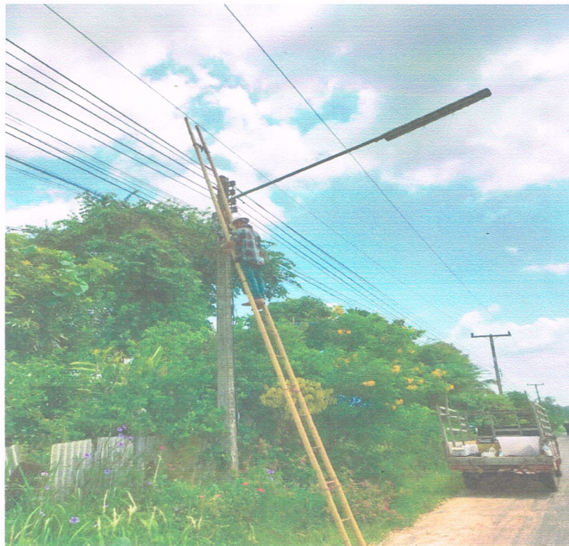
ขยายเขตไฟฟ้าส่องสว่างในพื้นที่ตำบลจานลาน